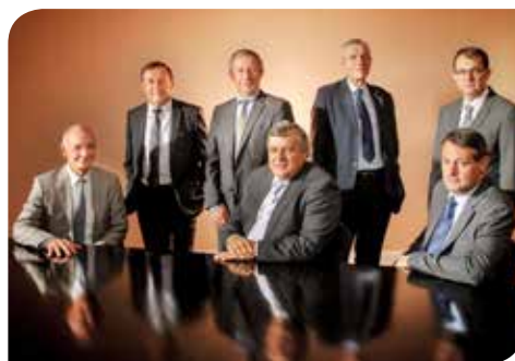
Le Conseil d'Administration

métier. Le soutien sans faille de notre actionnaire de référence, Limagrain, et de l'ensemble de nos Actionnaires, qui nous accompagnent fidèlement depuis 20 ans, nous permet plus que jamais d'aborder l'avenir avec confiance.